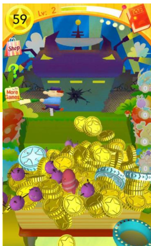
▲ レスキューモード画面