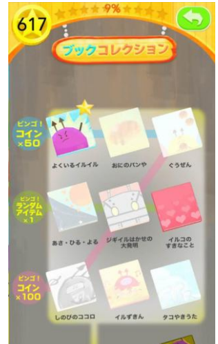
▲ ブックコレクション一覧

記事ご掲載用のゲーム画面素材をご用意しております。下記 URL からダウンロードしてご使用ください。 http://paperbooya.jp/press/coin.zip