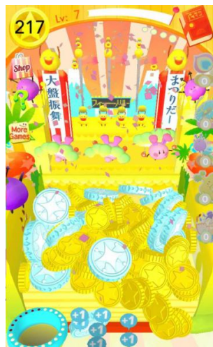
▲ カーニバルモード画面