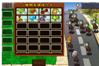
ステージ開始前にどのプラントを使用するか選択。