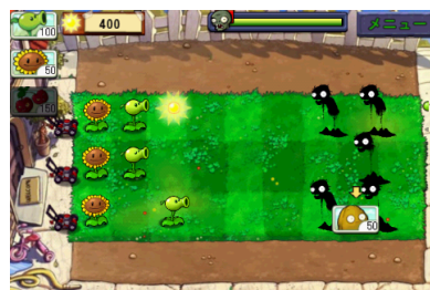
「チェリーボム」が炸裂すると周囲のゾンビが一網打尽。

収録されている「アドベンチャー」モードは、ステージをクリアしていくごとに使えるプラントが一つずつ追加され、ゲームの難易度も上がっていきます。一つのステージは数分でクリアできるので、ちょっと時間が空いたときに、気軽にお楽しみいただけます。