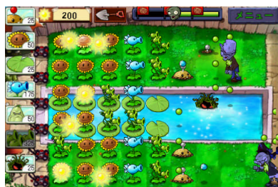
個性豊かなキャラクターたちが、所狭しと動き回る。