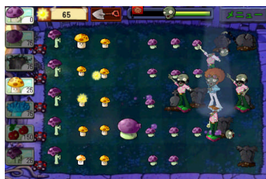
迫りくるゾンビをかわいらしいプラントたちが迎撃。