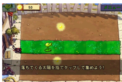
すべてのプラントの源、「太陽」をタッチして集める。

プラントの種類によって、それぞれ必要なコストや設置に要する時間が決まっています。必要となる「太陽」は少ないけれど攻撃力が弱いもの、高い攻撃力を持つけれど一つ植えるとしばらく植えることができないものなど、ステージの特徴に合わせて、戦略的にプラントを選択し、植えていくことが攻略のカギ。