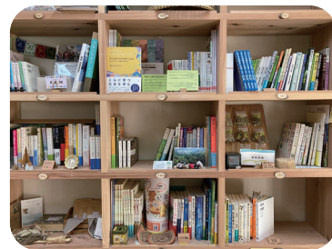
リブラリウムイメージ（写真は茨城県石岡市柿岡にある「つながる図書館」）