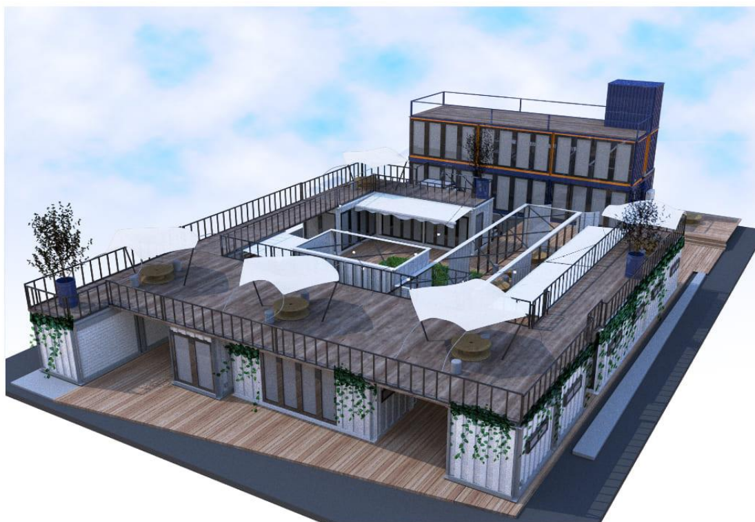
Craft Village NISHIKOYAMA

今後、ピーエイを主体としてUR都市機構が協働し、地元の方々の協力のもと、当施設での活動を展開していく予定であります。