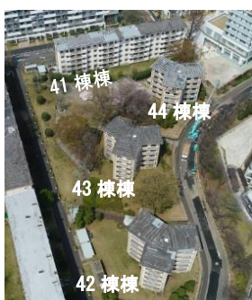
保存・活用エリア

第1回となる今回は、旧赤羽台団地エリアにおいて登録有形文化財として保存活用することになったスターハウスを舞台とします。テーマは「 スターハウスの未来にある暮らし 」。スターハウスでの「これからの暮らし方」を提案に含むことを条件に、新しいリノベーションのアイディアや提案をお待ちしています。