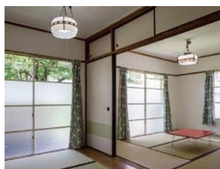
昭和37年の住戸再現イメージ（居間）