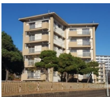
スターハウス外観(42号棟)