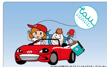
【T A Uオリジナルデザイン】