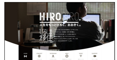
ひろしま移住サポートメディアHIROBIRO

このサイトでは、これまでの「田舎暮らし」ではなく、広島県の「都市と自然が近い」地域特性を活かして、「こだわり」や「夢」を諦めることなく、経済的にも満ち足りて、大都市の何倍も自己実現を図りながら、「新たな挑戦」をしている人々のライフスタイルを御紹介しています。なお、過去の移住促進セミナーの開催状況も掲載しています。