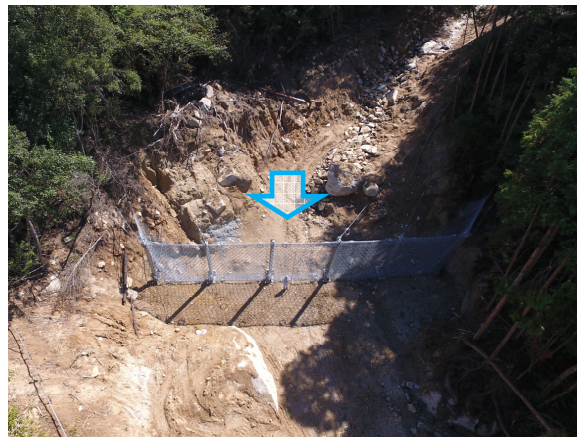
ワイヤーネット設置状況(上空より)