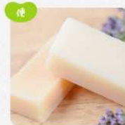
日用品・雑貨・その他