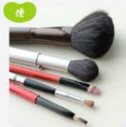
住宅用品・家具・工芸品