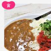
調味料・レトルト食品