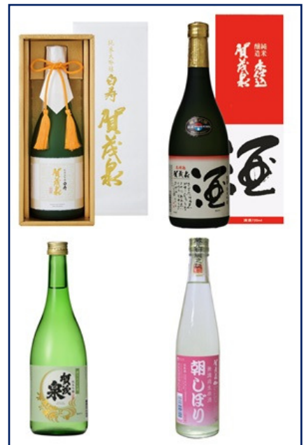
『賀茂泉』4種呑み比べ