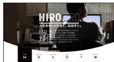
ひろしま移住サポートメディア「HIROBIRO.」

2015年3月に開設したウェブサイト、ひろしま移住サポートメディア「HIROBIRO.」では、これまでの「田舎暮らし」ではなく、広島県の「都市と自然が近い」地域特性を生かして、「こだわり」や「夢」を諦めることなく、経済的にも満ち足りて、大都市の何倍も自己実現を図りながら、「新たな挑戦」をしている人々のライフスタイルを御紹介しています。なお、過去の移住促進セミナーの開催状況も掲載しています。