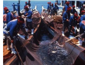
<鞆の浦鯛しばり網漁法>