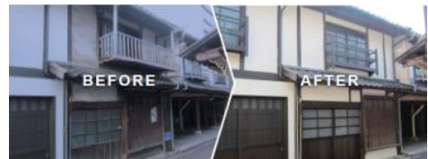
<伝統的建造物の保存修理の例>