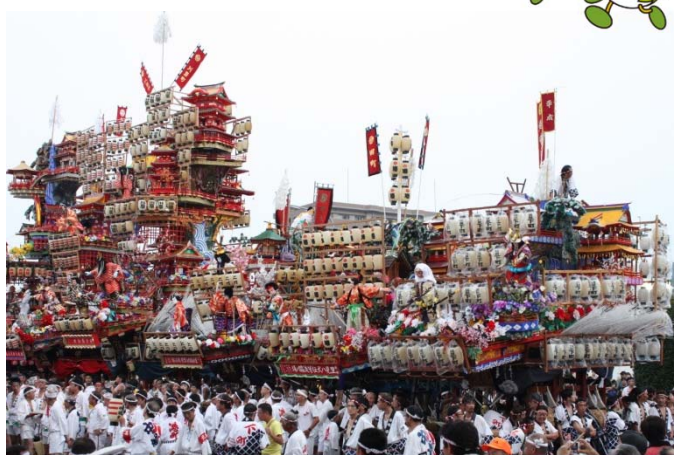
日田祇園祭集団顔見世

約300年の伝統を誇る日田の伝統行事「日田祇園祭」。疫病や風水害を払い安泰を祈るこの祭りでは、山車(だし)の一種である山鉾が花や人形、ちょうちんなどで豪華絢爛に飾り付けられ、祇園囃子の音色と共に隈(くま)・竹田地区、豆田地区の町並みを巡行します。目玉は7月23日(木)の集団顔見世で、JR日田駅前に各地区の山鉾全8基が一堂に会します。10mの高さの山鉾が並ぶ光景は圧巻です！