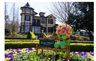
山手イタリア山庭園

「ガーデンネックレス横浜2024」の期間中、みなとエリアの各所には、横浜の街を背景にガーデンベアと一緒に写真が撮れるフォトスポットを多数設置しています。「横浜ローズウィーク」の期間に、バラめぐりと併せてお楽しみください。