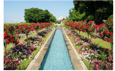
「バラと輝く噴水の庭」（過去）

ブラフ 18 番館、外交官の家が建つ公園です。「バラと輝く噴水の庭」というテーマでリニューアルされ、新たなバラの名所となりました。5月9日（木）には庭園のつくりや見ごろを迎えたバラを紹介する「山手イタリア山庭園 庭園ガイド」（当日先着 10 名、2 回）、5月18日（土）には「ローズコンサート」（雨天中止）が無料で開催されます。