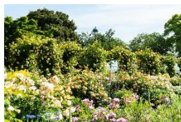
「イングリッシュローズの庭」

約190品種、800株のバラが楽しめる「イングリッシュローズの庭」をはじめ「バラとカスケードの庭」「香りの庭」など、趣ある西洋館を背景に色とりどりのバラの鑑賞や香