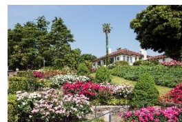
「バラとカスケードの庭」 (過去)

りを楽しむことができます。横浜市イギリス館では、5月11日(土)にお庭でティータイムを楽しむ「オープンガーデンピクニックティー」(事前申込制、先着25名、有料)、5月17日(金)にはバラに囲まれた屋外での「ローズコンサート」(雨天時は屋内)が無料で開催されます。