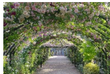
「ローズトンネル」 (過去)

2,200品種、2,800株のバラが咲く英国式庭園。コンセプトの異なる5つのエリアがあり、それぞれバラと草花が調和した美しい風景が楽しめます。特に入口から続くつるバラのトンネルは、春バラの咲くこの季節しか見られない特別な景色です。4月20日(土)～5月26日(日)に開催の「ローズ・フェスティバル」期間中には、朝一番でバラの香りを楽しめる、AM8:00からの「早朝プレミアム開園」が行われます。