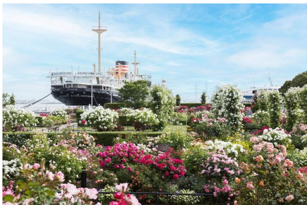
山下公園「未来のバラ園」(過去の様子)

横浜市では、3月23日（土）～6月9日（日）の期間で、横浜の街を舞台に美しい花と緑をネックレスのようにつなぐ「ガーデンネックレス横浜2024」を開催しています。5月3日（金・祝）からは、横浜市の花である“バラ”が最も美しく咲き乱れる期間に、街歩きをしながらバラを楽しむ「横浜ローズウィーク」が始まります。