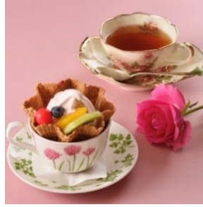
ローズソフトクリーム& ローズティーセット カフェ・ザ・ローズ