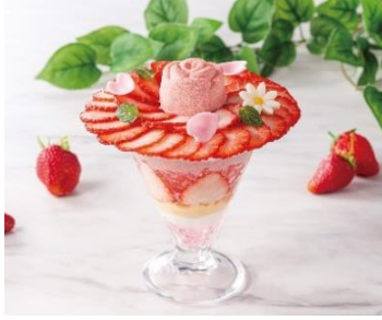
ローズパフェ ローズホテル横浜