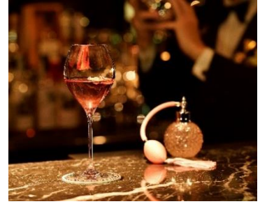
ローズカクテル「ピュアローズ」 ホテルニューグランド