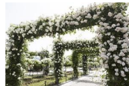
「未来のバラ園」 (過去)