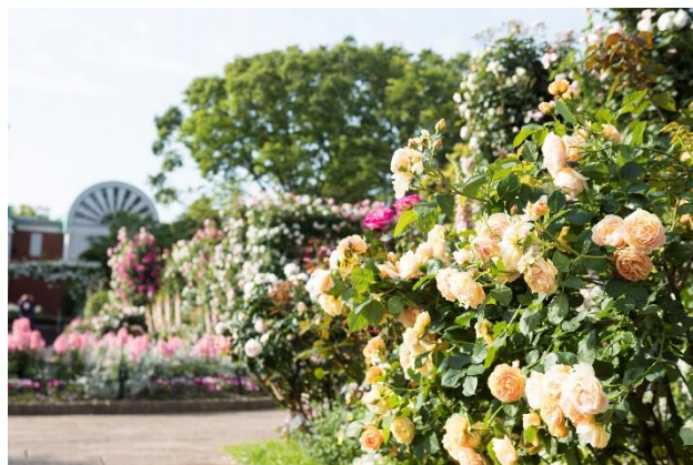
港の見える丘公園「香りの庭」(過去の様子)

4月に最盛期を迎えるチューリップから移り変わり、5月上旬からは横浜市の花“バラ”が見頃を迎え、『はまみらい』や『セント・オブ・ヨコハマ』などの横浜にちなんだバラをはじめ、2,000品種以上の色とりどりのバラが市内各所を彩ります。これらのバラの見頃に合わせて始まる「横浜ローズウィーク」の期間中は、フラダンスショーやガーデンコンサート、ローズマーケットなどのさまざまな催しを展開。また、横浜市内のホテル