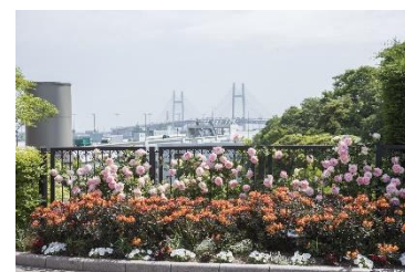
「アメリカ山公園」 (過去)

眺望のよい景観とあわせて140株のバラが咲き誇ります。園内の植物は無農薬で管理され、人と生き物、植物が調和を追求した公園づくりをしています。ローズウィーク期間中は、バラにちなんだ曲を使用したフラダンスショーや、アメリカ山公園産はちみつの販売などを行うマーケットが開催されます。