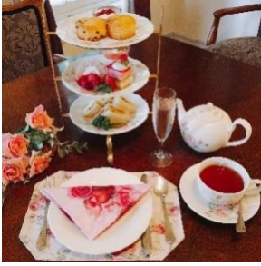
薔薇のアフタヌーンティセット えの木てい 本店