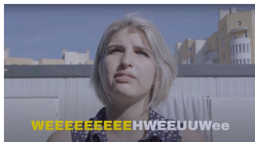
オープングループ《繰り返してください》2022