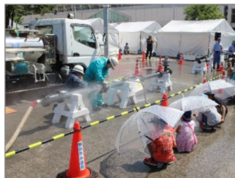
【 漏水修理デモンストレーション 】 (11時30分、14時00分を予定)