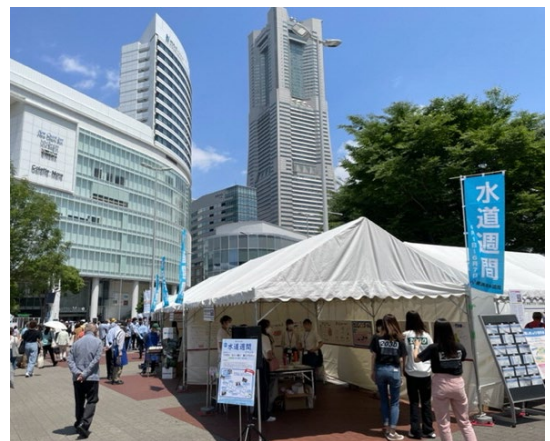
前回（令和4年度）の会場の様子