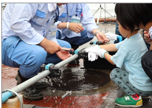
【 漏水修理体験コーナー 】