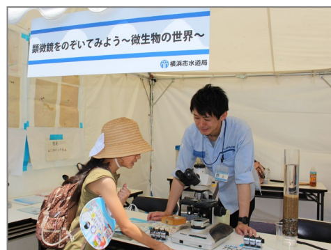
【 顕微鏡を使って水源の生物を観察 】