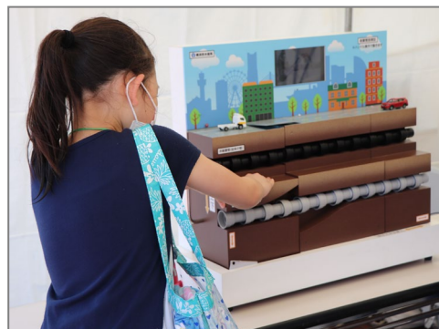
【 地震に強い水道管の仕組みを模型で学習 】