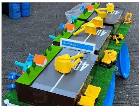
【 遊びながら水道工事を体験 】