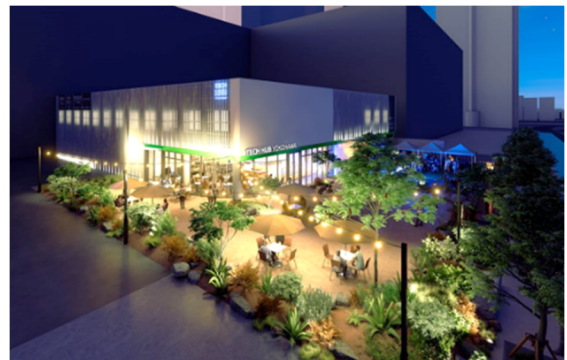
TECH HUB YOKOHAMA