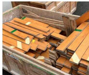
体育館フローリング古材

この度「CENTRAL FIELD」で、体育館の床材をアップサイクルしたテーブル等を設置。来場者にイベントを楽しんでいただきながら、自然とサステナブルな取組に触れていただきます。