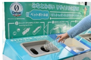
ボトル to ボトル (イメージ)

この仕組みを生かし、「CENTRAL FIELD」で発生する使用済みペットボトルを水平リサイクルし、地区内の脱炭素の取組を推進します。(地区内の音楽イベントでこの仕組みを活用するのは初めての試みとなります。)