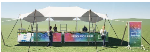
リソースハブ（イメージ）

こうした取組は、GREEN×EXPO 2027 の開催趣旨と親和性が高く、EXPO のプロモーションの一環として、『リソースハブ』でごみの分別にご協力いただいた方に先着で、ロスフラワーのポット苗をプレゼントします！（各日約 300 個配付予定）