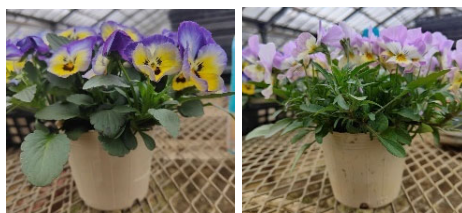
ロスフラワーのポット苗（左：パンジー、右：ビオラ）