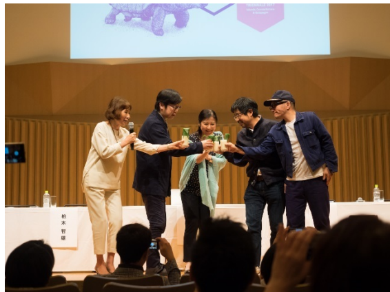
乾杯でパフォーマンスが締めくくられました

4月18日（火）のプレスリリースと記者会見資料は、ヨコハマトリエンナーレ2017公式ウェブサイトの下「プレス向け情報」でご覧いただけます。