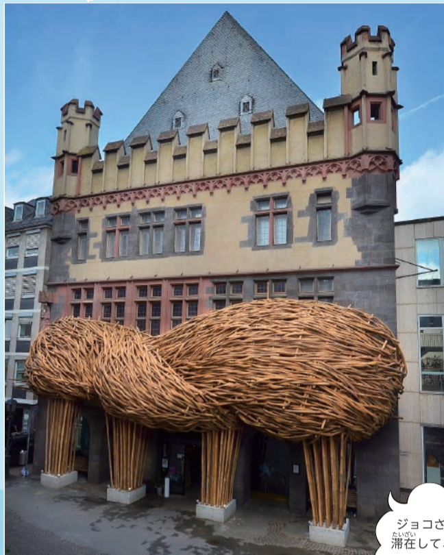
ジョコ・アヴィアント 《大きな木々》 2015