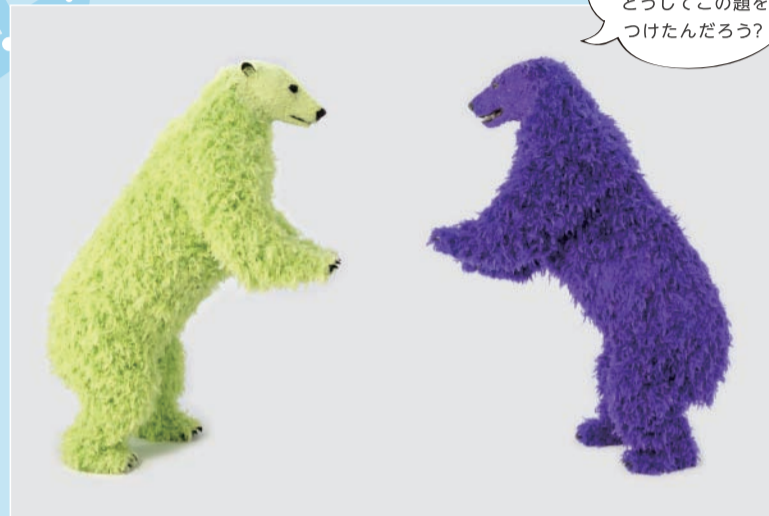
パオラ・ピヴィ 《I and I (芸術のために立ち上がらねば)》 2014