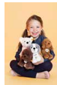
<乗って触れる動物たち>