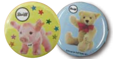
<シュタイフ缶バッジ>