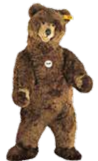
<等身大の動物たち>