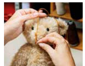
<ぬいぐるみがでるまで>