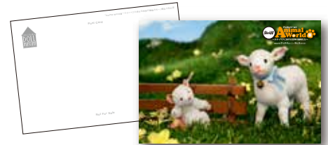
<オリジナルポストカード>