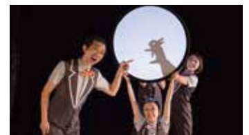
<プロに学ぶ動物影絵>