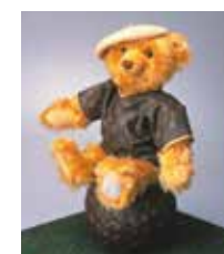
世界唯一<ルイ・ヴィトンベア>