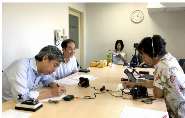
モールス信号録音風景

「ヨコハマサイトのマップ」と各サイトの解説は、公式WEBサイト「ヨコハマサイト」ページからダウンロードできます。 URL http://yokohamatriennale.jp/2017/event/2017/07/event13.html.html