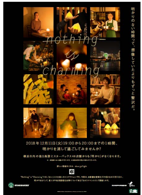
“Nothing” is “Charming” イベントポスター イメージ