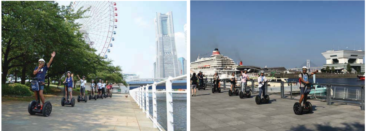
昨年夏のモニターツアーの様子。インストラクターを先頭に安全を確保しながら、横浜の臨海部を隊列で走行します。

この度、これまでの実験結果を踏まえ、国内で唯一、都心臨海部公道を走行するパーソナルモビリティツアーとして、みなとみらい地区を周遊するセグウェイによる一般向けガイドツアー（有料）を実施します。