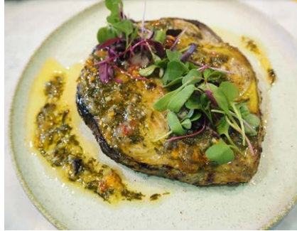
マグロのステーキ