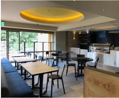
2階カフェレストラン店内写真