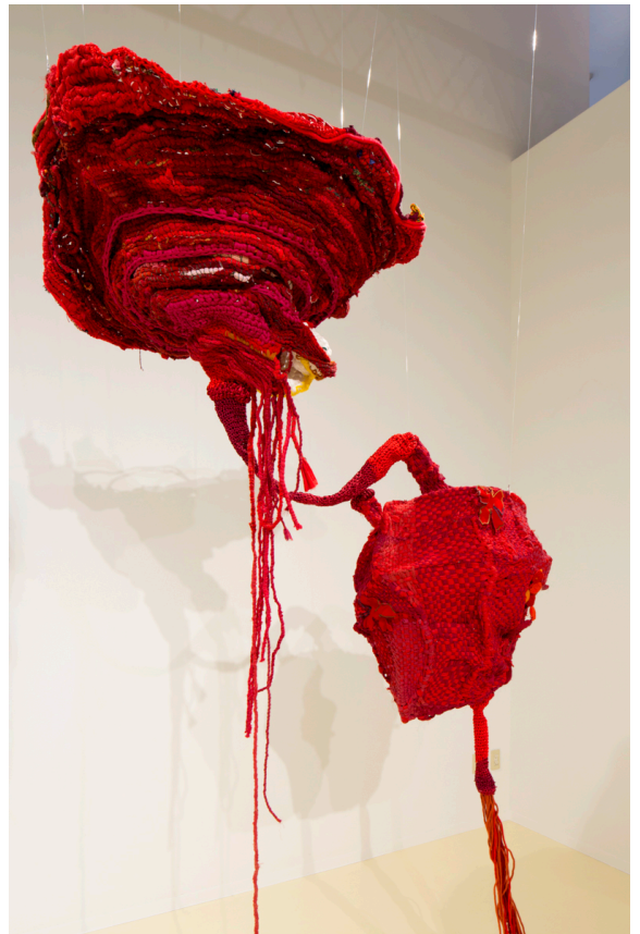
アリュアアイ・プリダン《生命軸》2018

【プレスリリースお問い合わせ】 ヨコハマトリエンナーレ2020広報事務局 (株式会社プラップジャパン: 横澤、本郷、増田) E-MAIL: yokotori2020pr@prap.co.jp TEL 03-4580-9109 【横浜トリエンナーレ組織委員会 お問い合わせ】 横浜トリエンナーレ組織委員会事務局広報担当 (高橋) E-MAIL: press@yokohamatriennale.jp TEL 045-663-7232 (平日10:00~18:00)