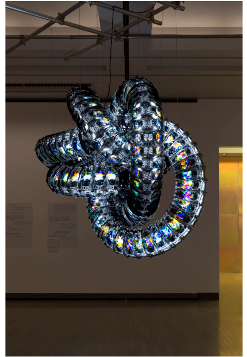
キム・ユンチョル《クロマ》2020