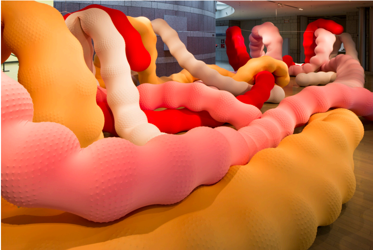
エヴァ・ファブレガス《からみあい》2020