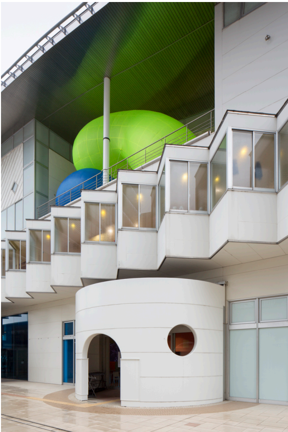
さとうりさ《双つの樹 (黄、青)》2020