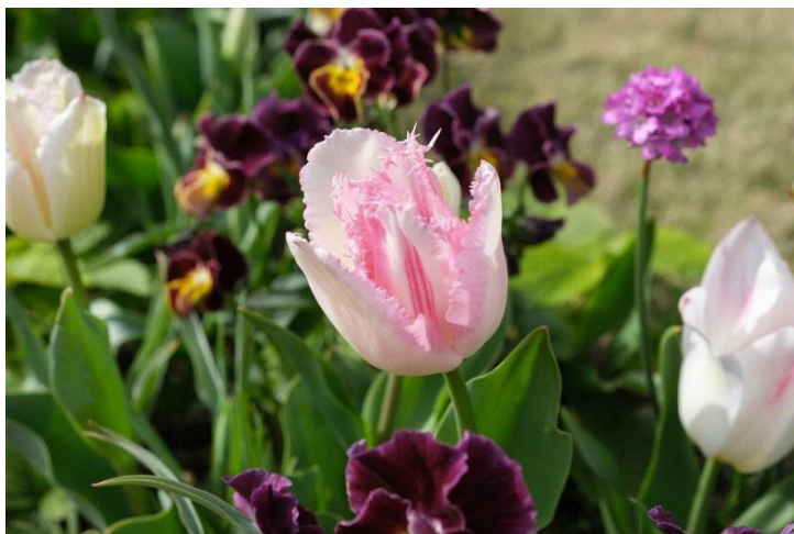
里山ガーデン ラバースタウン (3月29日撮影)

※白からピンクへ移り咲きをする横浜市限定の希少な品種「ラバースタウン」は、港の見える丘公園、アメリカ山公園、元町公園、山手公園、山手イタリア山庭園、里山ガーデンでご覧いただけます。各会場に咲く「ラバースタウン」巡りもおすすめです。