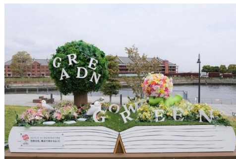
ガーデンベアフォトスポット (会場によりデザインは異なります)

4月10日（土）から、「花と緑のデジタルスタンプラリー」を実施します。マスコットキャラクター「ガーデンベア」と一緒に写真が撮れる「ガーデンベアフォトスポット」を6カ所以上巡ると、ガーデンベアグッズ等のプレゼントがもらえます（先着順）。