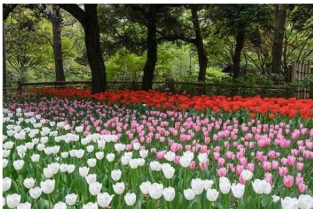
横浜公園 12万本のチューリップ (4月1日撮影)

横浜市限定のチューリップ品種「ラバースタウン」（次ページに写真）は、山下公園や里山ガーデンなどで観賞することができます。花卉の上部にフリルが入り、咲きながら白からピンクへ花色が変化する移り咲き品種で、現在、横浜市内だけに植えられている希少な品種です。