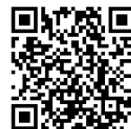
ガーデンネックレス横浜・ 公式 YouTube チャンネル