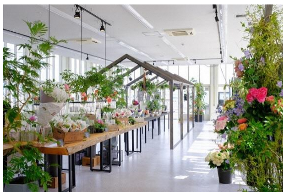
インフォメーションセンター内観