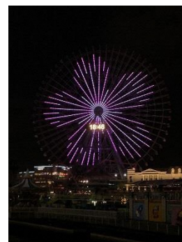
「コスモクロック 21」 イルミネーション イメージ