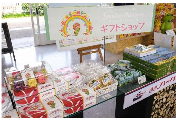
ガーデンベアグッズ