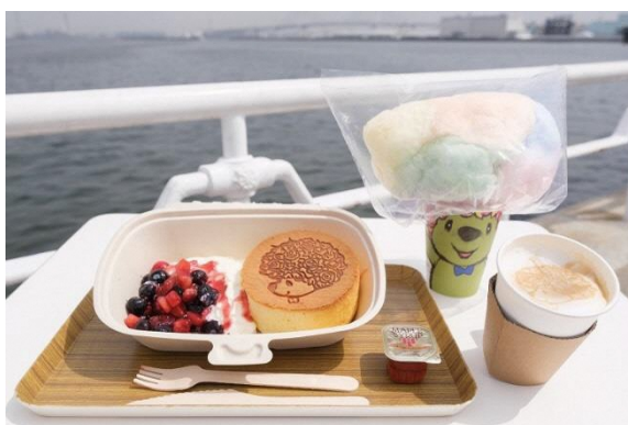
キッチンカー販売のガーデンベアフード (販売がない日、売切れの場合もございます)