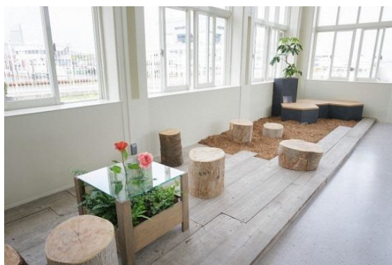
「みどりのアップサイクル」によるキッズコーナー（丸太イス、チップ）