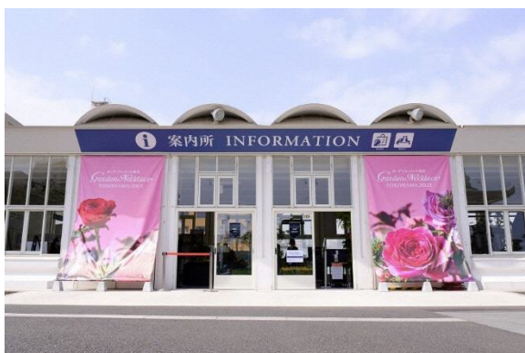
インフォメーションセンター外観