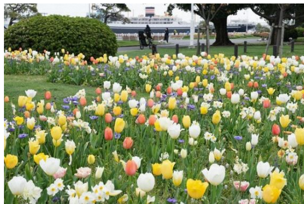
山下公園 球根ミックス花壇 (4月2日撮影)