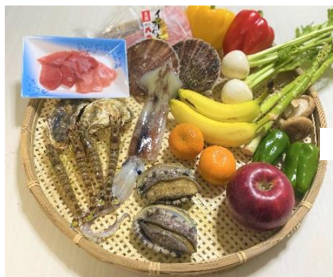
▲プレミアムコース (二人前イメージ)