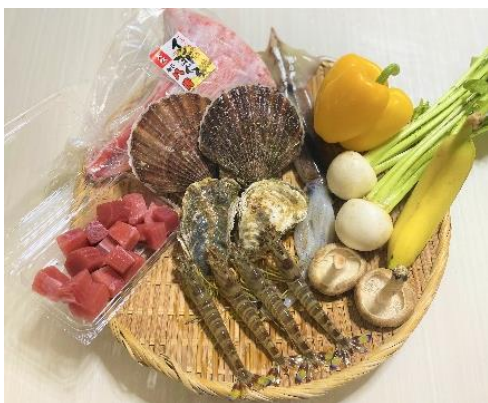
▲レギュラーコース (二人前イメージ)