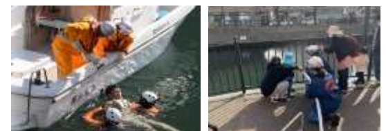
②水難救助訓練等の様子