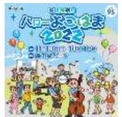
ハローよこはま イメージビジュアル