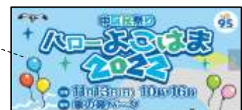
③中区民祭り「ハローよこはま2022」（11/13） 会場：象の鼻パーク