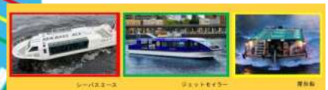
③新規運航の船舶（3種類）