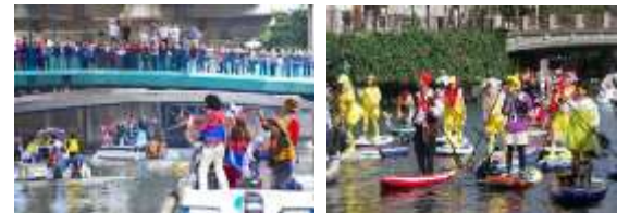
①運河パレードの様子