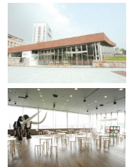
展示会場：象の鼻テラス(横浜)

本リリースの内容に関するお問い合わせ ※本リリース掲載画像はこちらからダウンロードいただけます： https://bit.ly/3WY5Svq