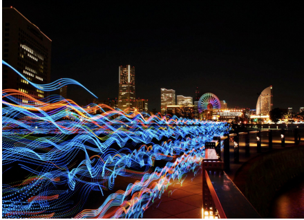
《Speed of Light Yokohama - 3 movements》NIVA (スマートイルミネーション横浜2012)