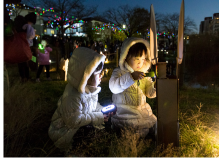
スマートイルミネーションいずみ(2017)