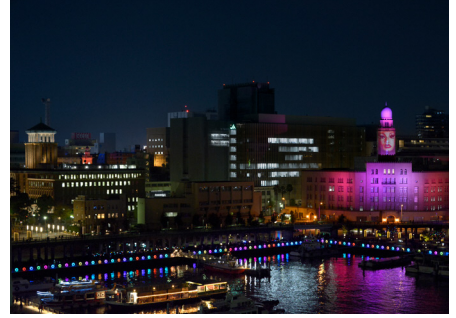
《たてものおしほい「塔(クイーン)は歌う」》高橋匡太 (スマートイルミネーション横浜2015)

象の鼻テラスは、2022年12月9日(金)～11日(日)開催のアートイベント「フューチャースケープ・プロジェクト2022」にあわせて、第1回「フューチャースケープ・フォトコンテスト」を開催します。