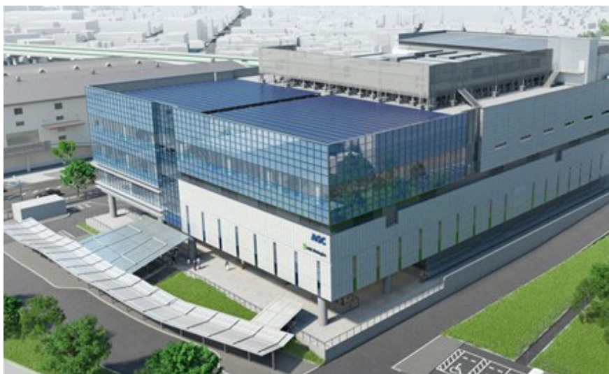
▲新施設の完成予想図