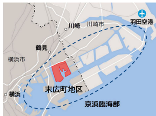
▲京浜臨海部（末広町地区）位置図