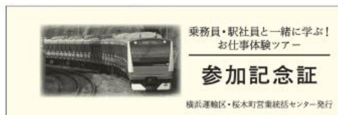
オリジナル参加記念硬券（表面）

ご参加いただいた皆さまに、「オリジナル参加記念硬券（台紙付き）」をプレゼントします。返礼品ツアーの当日、台紙には横浜運輸区と磯子駅のスタンプでスタンプを押印します。