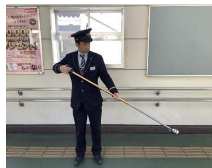
落とし物拾得作業