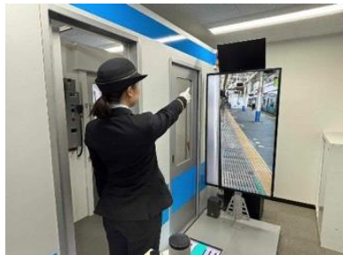
車掌シミュレータ