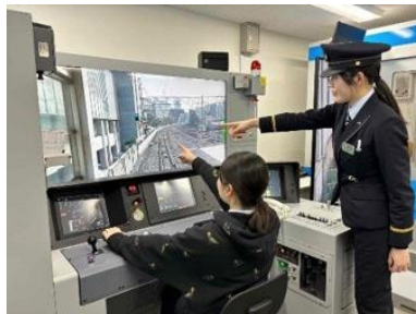
運転士シミュレータ