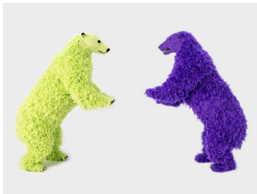
パオラ・ピヴィ《I and I(芸術のために立ち上がらねば)》2014

【プレスリリースお問い合わせ先】ヨコハマトリエンナーレ2017広報事務局（株式会社プラップジャパン：桑間、横澤） E-MAIL: pr_yokotori2017@ml.prap.co.jp TEL 050-5243-8863 (03-4580-9110)