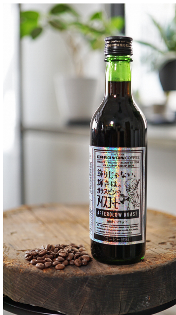
（右）小山飛鳥／アスカコヤマックス アイスコーヒー 594円（税込） 光の破片をちりばめたようなオリジナルラベルがポイント。横浜のキャラバンコーヒーとのコラボレーション商品。