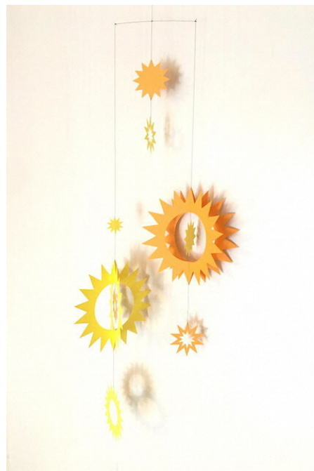
山口みつ子／PUKAPUKA モバイル「hikari」 2,300円（税込） 物語のようなモバイルの世界を生み出すクリエイターの新作は「光」。 風と光の競演を楽しめる作品です。