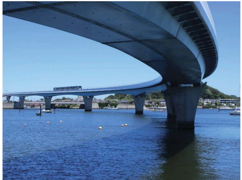
シーサイドライン