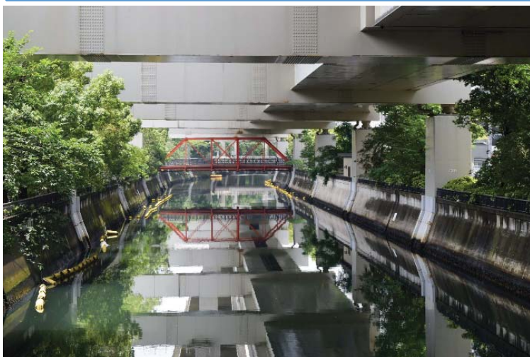
【道路局長賞】中村川に映える赤いトラスの浦舟水道橋