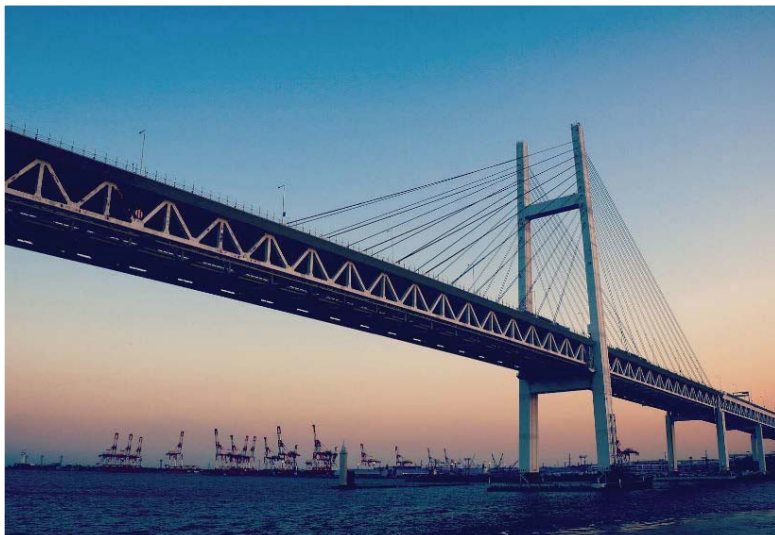
横浜ベイブリッジ