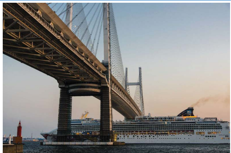
【横浜の橋賞】客船ベイブリッジをくぐる！