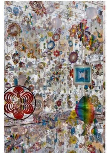
ニック・ケイヴ《回転する森》2016(2020年再制作) ©Nick Cave