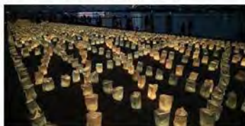
※雨天の場合は9月27日(日)、10月3日(土)、4日(日)のいずれかに延期

アメリカ山公園に約5,000個のろうそくで中華街・洋館をモチーフにした地上絵を描きます。日が暮れた頃に火を灯し、幻想的な光の空間を作り出します。