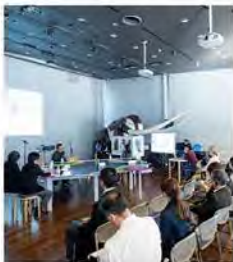
<参考>スマートイルミネーション・サミット2019

象の鼻テラスではKOSUGE1-16の作品展示や、イギリス・香港からゲストを迎えオンライン配信で行うサミットを開催。パークでは、世界と横浜を繋ぐ高橋匡太によるアートプロジェクト「ひかりの実」や、駅・日本大通りと同時多発に展開するスイッチ総研の演劇などを実施します。 ( http://fsp.zounohana.jp/2020/ )