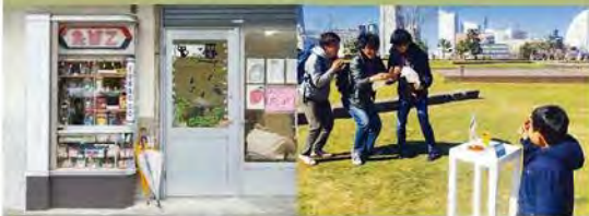
KOSUGE1-16's Kids(駄菓子屋 たばこ)

アートの創造性で公共空間活用を行う「FUTUREScape PROJECT」の駅会場として展開。子供も大人も集う交流拠点として、KOSUGE1-16's Kidsによる《駄菓子屋 たばこ》を設置、夜はふらりと立寄れる「スナック」となります。また、9月26~27日には、「スイッチを押すと始まる3秒~30秒の演劇」でお馴染みスイッチ総研の作品も楽しめます。