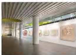
川俣正 ドローイングアーカイブ 参考写真

BankART Stationは、新高島駅改札階からあがった地下1階にあるアートスペース。日本を代表するアーティスト川俣正のドローイング展を開催。BankART Temporary(馬車道駅)で展開しているインスタレーションと共通で観覧料は1,000円。ヨコトリ2020連携チケットでも観覧可能。(http://www.bankart1929.com/)