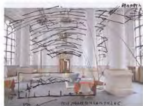
川俣正「BankART Life VI」のためのドロワーイング

工事用足場単管と仮囲い安全鋼板を用い、1Fホールと外壁ファサード(バルコニー部分)に巨大なインスタレーションを展開します。(http://www.bankart1929.com/)