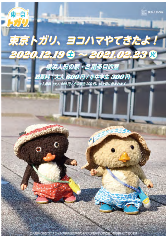
〈チラシ画像_オモテ面Aパターン〉

SNSで話題騒然の「東京トガリ」をご存知ですか？ 東京トガリは映画とレコードとジンジャーエールが大好きな、宇宙から来た4才の男の子。そんな不思議でかわいいトガリくんにはノラくんという弟がいて、居候のみいむんと一緒に住んでいます。そして好きなことや得意なものがたくさんあります。東京トガリ初の大型展示となる本展では、人気沸騰中のSNS画像などから選りすぐりのかわいい画像や横浜の観光スポットを巡った撮り下ろしをパネル展示いたします。 そして全国を巡回してきた期間限定ショップ「東京トガリ 2020 JAPAN TOUR」は横浜人形の家でFINALです！当館ショップにてオリジナルグッズ販売もいたします。