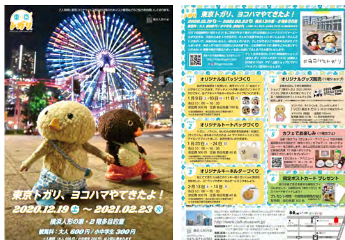
〈チラシ画像_オモテ面Bパターン〉

SNSで話題騒然の「東京トガリ」をご存知ですか？ 東京トガリは映画とレコードとジンジャーエールが大好きな、宇宙から来た4才の男の子。そんな不思議でかわいいトガリくんにはノラくんという弟がいて、居候のみいむんと一緒に住んでいます。そして好きなことや得意なものがたくさんあります。東京トガリ初の大型展示となる本展では、人気沸騰中のSNS画像などから選りすぐりのかわいい画像や横浜の観光スポットを巡った撮り下ろしをパネル展示いたします。 そして全国を巡回してきた期間限定ショップ「東京トガリ 2020 JAPAN TOUR」は横浜人形の家でFINALです！当館ショップにてオリジナルグッズ販売もいたします。