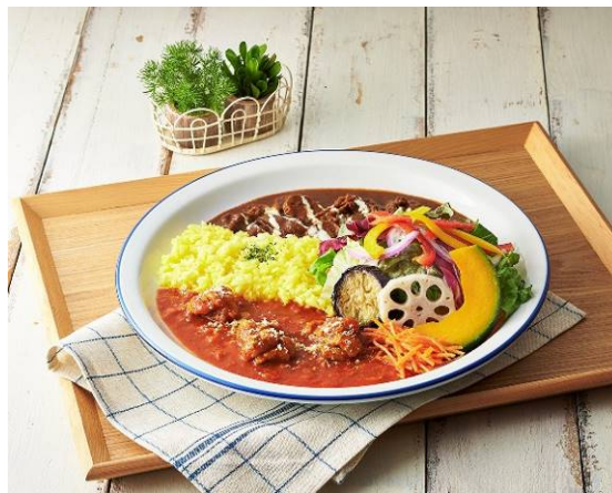
2種盛り〜チキンのトマト煮込み&25種のスパイスビーフカレー〜 単品 880円(税込)

たっぷりの玉ねぎとデミグラスソースをベースに25種類のスパイスで仕上げた風味豊かなビーフカレーやトマトの旨味溢れる真っ赤なチキン煮込みみライスを販売しております。