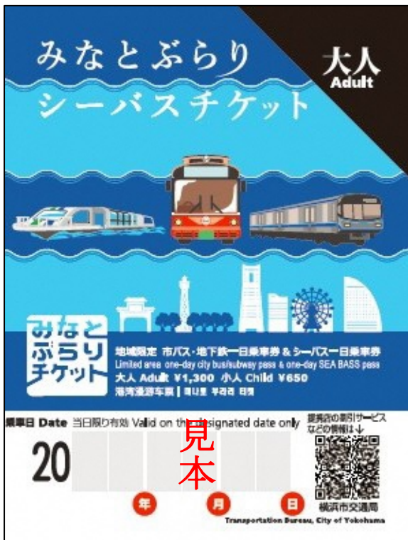
【チケット券面（見本）】