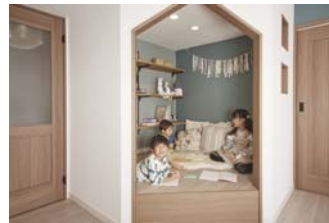
子どもが喜ぶ“秘密基地”のあるリビング

キッチンからはリビングダイニング全体が見渡せ、作業しながら子どもの様子を見守ることができる