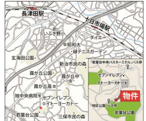
物件の位置図：旭区若葉台3-10棟