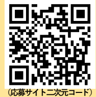
(応募サイト二次元コード)

9月25日(日) A_18:00~18:30 / B_18:30~19:00 C_19:00~19:30 / D_19:30~20:00 9月26日(月) A_16:00~16:30 / B_16:30~17:00 C_17:00~17:30 / D_17:30~18:00 E_18:00~18:30 / F_18:30~19:00 G_19:00~19:30 / H_19:30~20:00