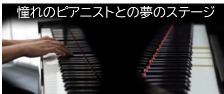
憧れのピアニストとの夢のステージ