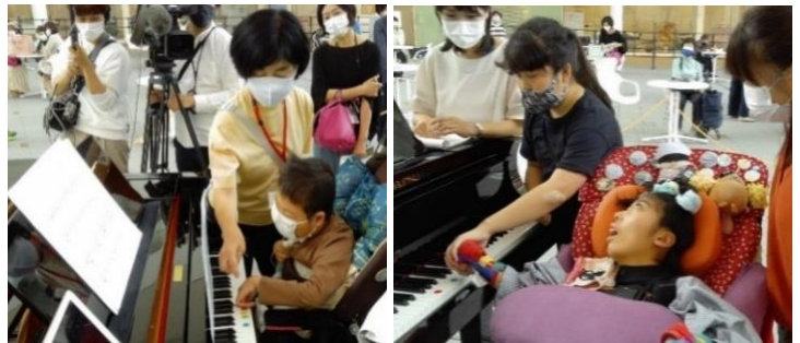
こどもハッシン！-呼吸器生活向上Project-メンバーによる発表会の様子

「こどもハッシン！-呼吸器生活向上Project-」 のメンバー6名がゲストピアニストとして、 イベントの幕開けを飾ります！ 「だれでもピアノ®」の開発にあたり、特別研究 員として活躍したメンバーのみなさんの演奏を お楽しみください。