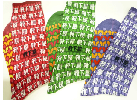
靴下屋 成田空港店限定 プリントソックス

左: 飛行機柄、右: 靴下屋柄 (22~24 cm 1,575 円、25~27 cm 1,680 円)