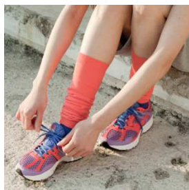
TABIO SPORTS レッグウォーマー 【価格】¥1,260(税込) 【サイズ】フリー 【カラー】8色