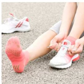
TABIO SPORTS レーシングラン 【価格】¥1,575(税込) 【サイズ】SS/S/M/L 【カラー】9色