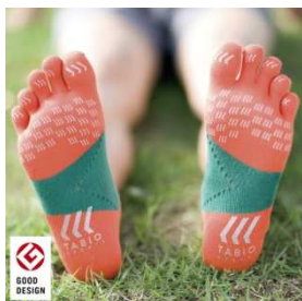
TABIO SPORTS レーシングラン5本指 【価格】¥1,680(税込) 【サイズ】SS/S/M/L 【カラー】10色