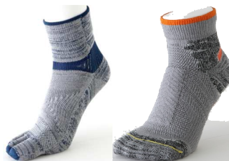
< 5本指タイプ >