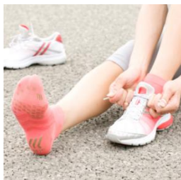
TABIO SPORTS レーシングラン 【価格】¥1,575(税込) 【サイズ】SS/S/M/L 【カラー】9色