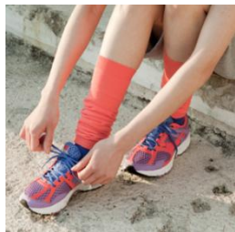
TABIO SPORTS レッグウォーマー 【価格】¥1,260(税込) 【サイズ】フリー 【カラー】6色