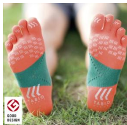
TABIO SPORTS レーシングラン5本指 【価格】¥1,680(税込) 【サイズ】SS/S/M/L 【カラー】9色