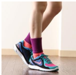
TABIO SPORTS レッグバンド 【価格】¥1,050(税込) 【サイズ】フリー 【カラー】6色