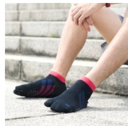
TABIO SPORTS レーシングラン足袋ソックス 【価格】¥1,680(税込) 【サイズ】S/M 【カラー】9色