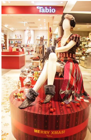
Tabio 表参道ヒルズ店での展示の様子