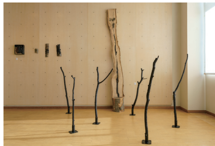
伊藤大悟「いま、ある森の中で」展示風景 2025年