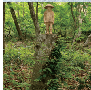
山本 晶ワークショップ参加者作品 2023年 加々見太地《菅笠の人》2024年