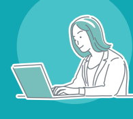
ホワイトボードムービー