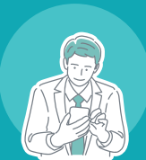
マーケティング検定