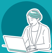
SBO 検定 1 級保持者