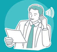
販促物作成職人 プリントウェア・看板・車両デザイン等