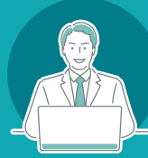
システムエンジニア