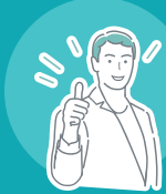
グラフィックデザイナー