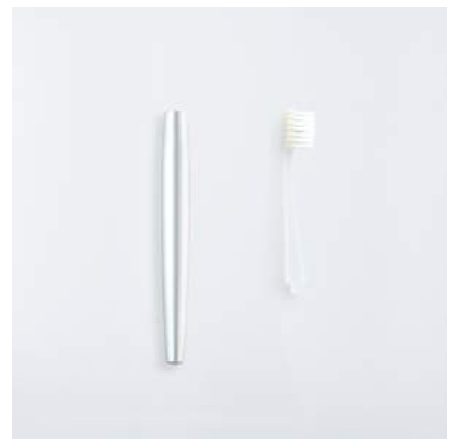
ハンドル+ブラシカートリッジ