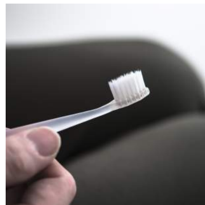
ブラシカートリッジ